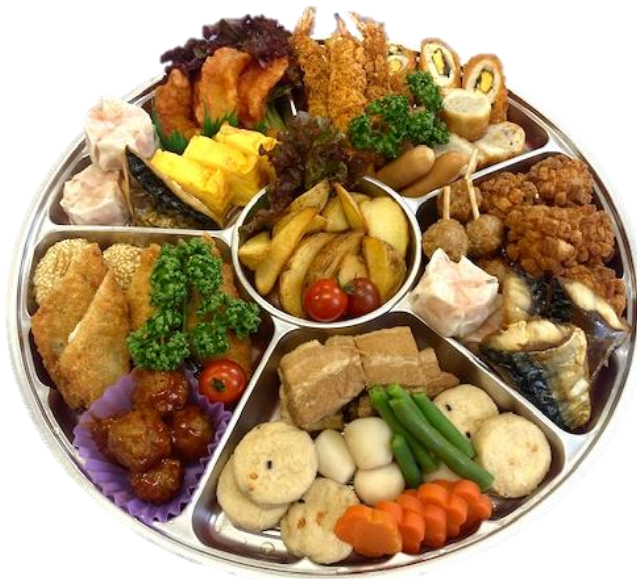
※これらの商品は5名分のイメージです。

ウオクニは1964年に創業し、食に関するサービスを展開しています。お客様に満足していただける心のこもったサービスで、皆さまに愛され、親しまれる企業づくりをめざしています。